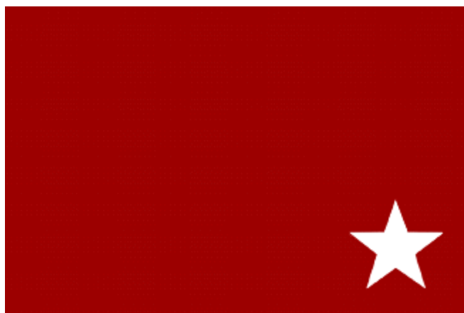
Flamuri i Esat Pashe Toptanit dhe qeverise se tij provizore te 1913